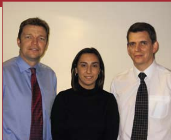
Lotus Bakeries UK operationeel