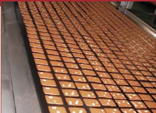
Amandelkoekjes in Briec – opstart nieuwe lijn