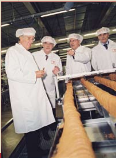
Bezoek Z.M. Koning Albert II